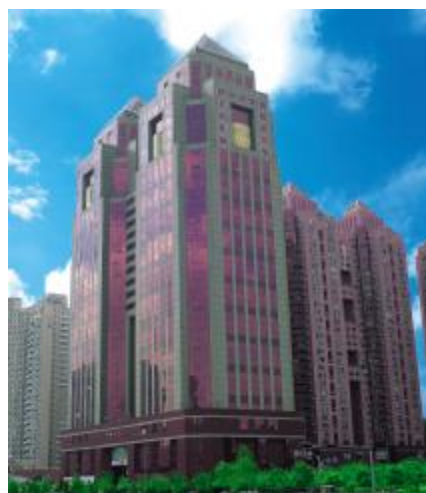
▲全部采用格力中央空调的深圳中银大厦

据悉，格力空调一年在深圳的销售额接近8亿元，位居深圳空调市场首位。此次入选“深圳名片”，再次佐证了格力电器无论在规模，还是在市场营销上都是中国家电业最成功的企业。