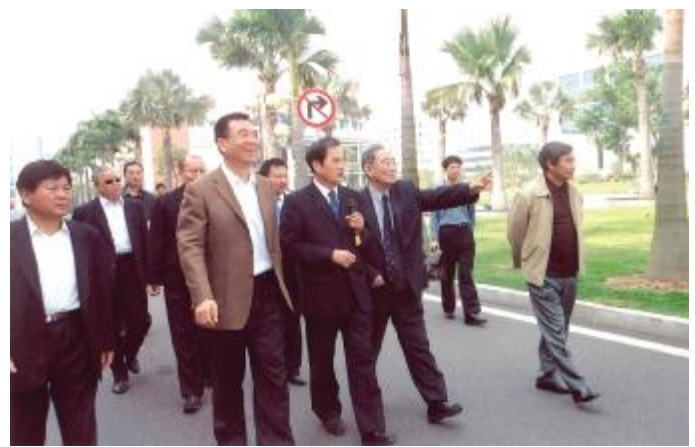
▲知名经济学家厉以宁(右二)对格力电器的现代化厂区大加赞赏。

在朱江洪董事长的陪同下,厉以宁一行参观了产品展览厅、研发中心和生产车间,详细了解了格力电器在优化产业结构、加大自主创新、注重人才培养以及企业主动走出去,参与国际市场等相关情况后予以高度评价。