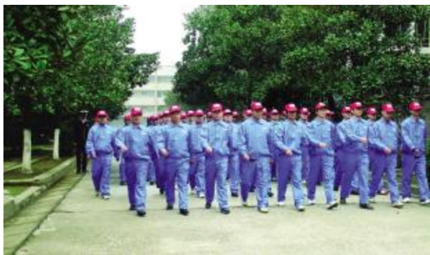
▲通过军训，湖北销售公司全体员工的精神面貌焕然一新。

本报讯 11月4日至13日，江城寒风阵阵，湖北销售公司近160名员工分两批进行了为期三天的全员军训。